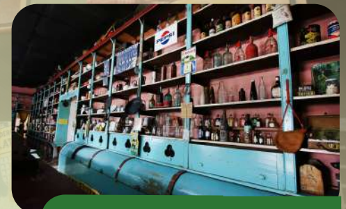
Centro Cultural y Museo Histórico Municipal "La Florida" - Arata

Este sitio fue inaugurado hace 100 años atrás por la Familia Norverto, que había emigrado desde Marruecos para instalarse en Arata y ejercer el comercio. En el 2001 el lugar se vendió a la Municipalidad y pasa a ser museo, conservando la totalidad de su estructura. El edificio mantiene intactas sus paredes de material y prolijo mobiliario construido con madera importada de Brasil.