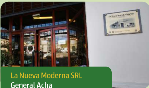
La Nueva Moderna SRL General Acha

La fachada centenaria conserva su aspecto original, salvo que ya no cuenta con el surtidor de combustible. Los galpones de almacenamiento se usan hoy para la construcción de mangas y tranqueras. El comercio ha desarrollado líneas de artículos inspirados en los almacenes tales como enlozados, manteles con motivos naturales, flores de tela, tés, sahumeros, impresos