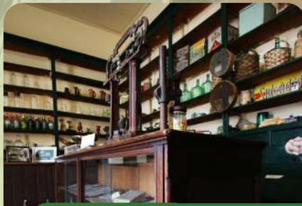
Museo Municipal "El Almacén de Pepa", Intendente Alvear