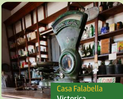
Casa Falabella Victorica