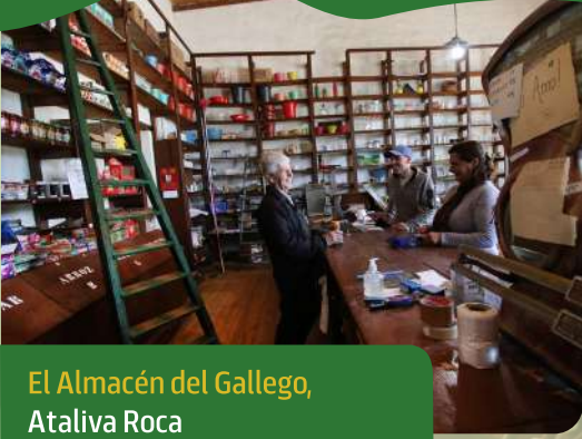
El Almacén del Gallego, Ataliva Roca

El Almacén del Gallego vendía antiguamente todo tipo de mercadería de ramos generales, y hoy en día sigue con sus puertas abiertas. El edificio que lleva en pie 115 años, se conserva en forma original a excepción del techo que sufrió algunas reformas debido al deterioro producido por un tornado.