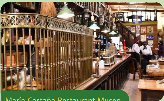
María Castaña Restaurant Museo Toay

Fue inaugurado el Día de la Tradición en el año 2011. Desde su arquitectura, fue creado como un antiguo edificio de ramos generales. Cuenta con aberturas originales recicladas, pisos de ladrillos y tirantes de pinotea.